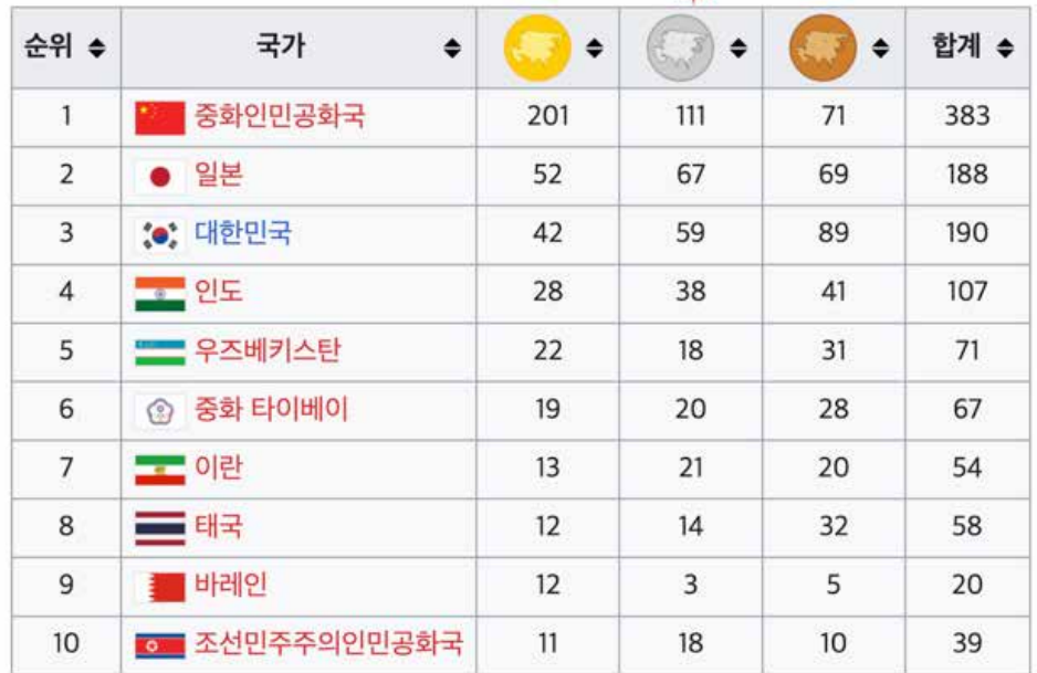
2022년 아시안 게임 메달 집계

으로 보내주신 하나님께 감사 드리며 살고 있답니다. 70년대 그때는 이곳에서 영어도 잘 못 해 고생하며 한국 사람, 한식 등의 그리움으로 살고 있었기 때문에... 더욱 하나님께 매달리며 감사하며 살았기 때문이지요. 그러면서 믿음이 성장하였습니다.