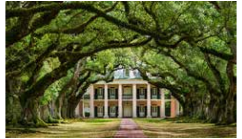
Plantation oak Alley

오후에는 1시간 떨어진 200년 전 역사의 현장인 옥엘 리 플랜테이션을 방문했다. 1800년 사탕수수 농장의 규모와 그 시대를 살아가는 현장을 볼 수 있으며, 목장 뒤에는 300년 된 참나무가 펼쳐진 정원이 아름다웠다. 오늘날 뉴올리언스의 농장 표지물이 됐다. 이외에도 가장 오래되고 유명한 후마스, 로라, 세인트 조세프 등의 농장을 관람하며 식사와 투어를 통해 역사의 길을 걸어보자, 돌아오는 길에는 늪지대의 악어 호수 사파리 투어로 뉴올리언스의 낮은 늪지대를 관람하고 느껴보자.