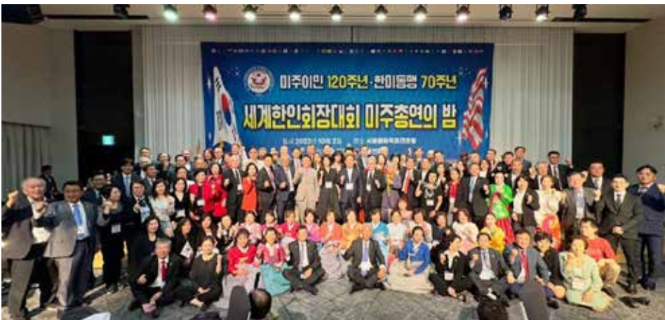
세계한인회장대회/한국방문 중의 사진