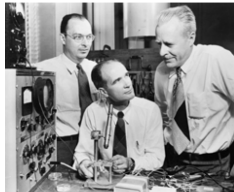
(사진) 미국 벨연구소의 (From Left) 존 바딘, 윌리엄 쇼클리, 월터 브래튼 (1948)

아까 위에서 간단하게 살펴 본 바와 같이 오늘날에는 반도체가 들어있지 않은 전자제품을 찾아볼 수 없을 정도로 삶의 일부가 되었다. 이러한 반도체 시대의 시작은 전자혁명이라고 이르는 ‘트랜지스터’의 발명으로 거슬러 올라간다. 트랜지스터는 transit resistor의 조어로 ‘변화하는 저항을 통한 신호 변환기’라는 뜻이다. 미국 벨연구소의 월터 브래튼, 윌리엄 쇼클리, 존 바딘이 1948년 트랜지스터를 최초로 만들어 이 공로로 1956년 노벨상을 수상하기에 이른다.