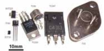
(사진) 트랜지스터의 여러종류

했다. 크고 비싼 데다 수명도 짧았던 진공관과 달리 트랜지스터는 크기가 작고 만들기도 쉬웠을 뿐 아니라 가격도 무척 저렴했다. 트랜지스터는 순식간에 시장을 휩쓸어 진공관을 퇴출시켰다. 이와 함께 전자제품들은 이전보다 성능은 높으면서 크기는 작아졌다.