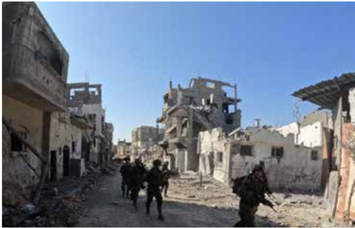
이스라엘군 장병들이 가자지구에서 작전을 벌이고 있다며 이스라엘군 당국이 31일 공개한 사진.

2023년 10월 7일 하마스가 이끄는 팔레스타인 무장 단체가 이스라엘에 대한 가자 지구의 무력 침공으로 이스라엘-하마스 전쟁이 시작되었다.